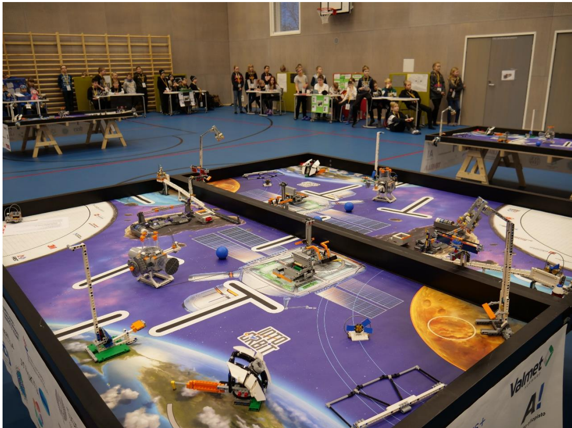
Näyttelyalue ja robottikilpailu liikuntasalissa